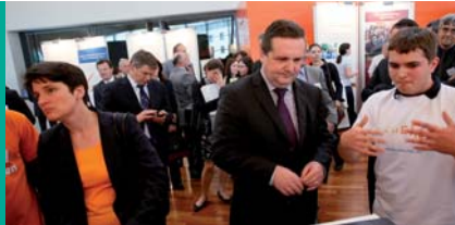
Der Ministerpräsident zu Besuch

Abschlussfeiern und Abibälle Der Juli ist der Monat der Abschlussfeiern und Abibälle. Einige Schulen richteten ihre Bälle im Neckar Forum aus, um dort ihren Abschluss in stilvollem Ambiente gebührend zu feiern.