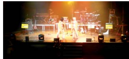
Verbandstag mit Showeffekt